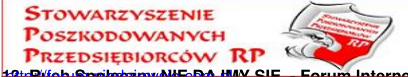
19. P/ich Spółdzielni NIE DAJMY SIĘ Forum Internetowe

Ruch Społeczny Nie Dajmy Się Ruch Społeczny NIE DAJMY SIĘ