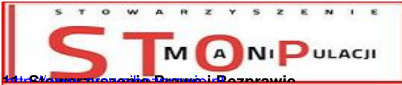
13. Stowarzyszenie Prawo i Bezprawie

Prawo i bezprawie RAZEM PRZECIWKO BEZPRAWIU